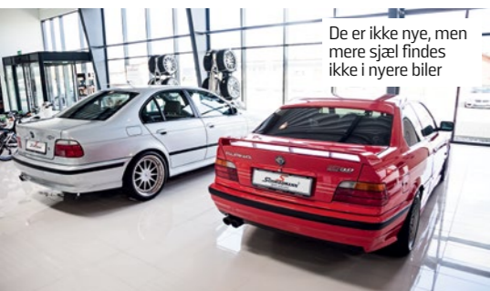
De er ikke nye, men mere sjæl findes ikke i nyere biler