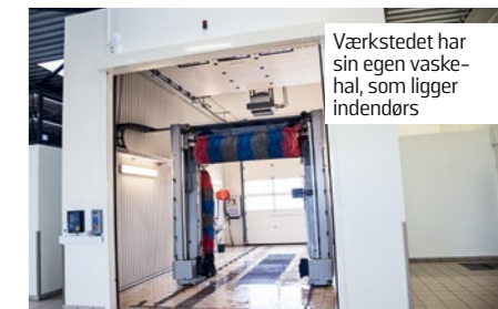
Værkstedet har sin egen vaskehal, som ligger indendørs

UDSTYRET til firehjulsdumålning er toppen af serien fra Hunter og virkelig lækkerier.