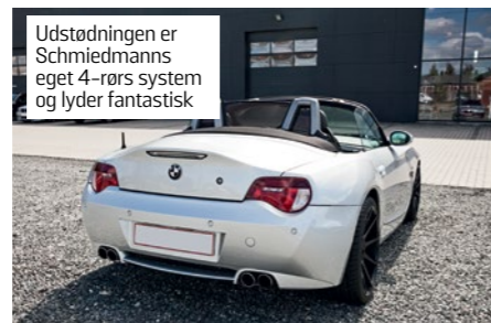
Udstødningen er Schmiedmanns eget 4-rørs system og lyder fantastisk