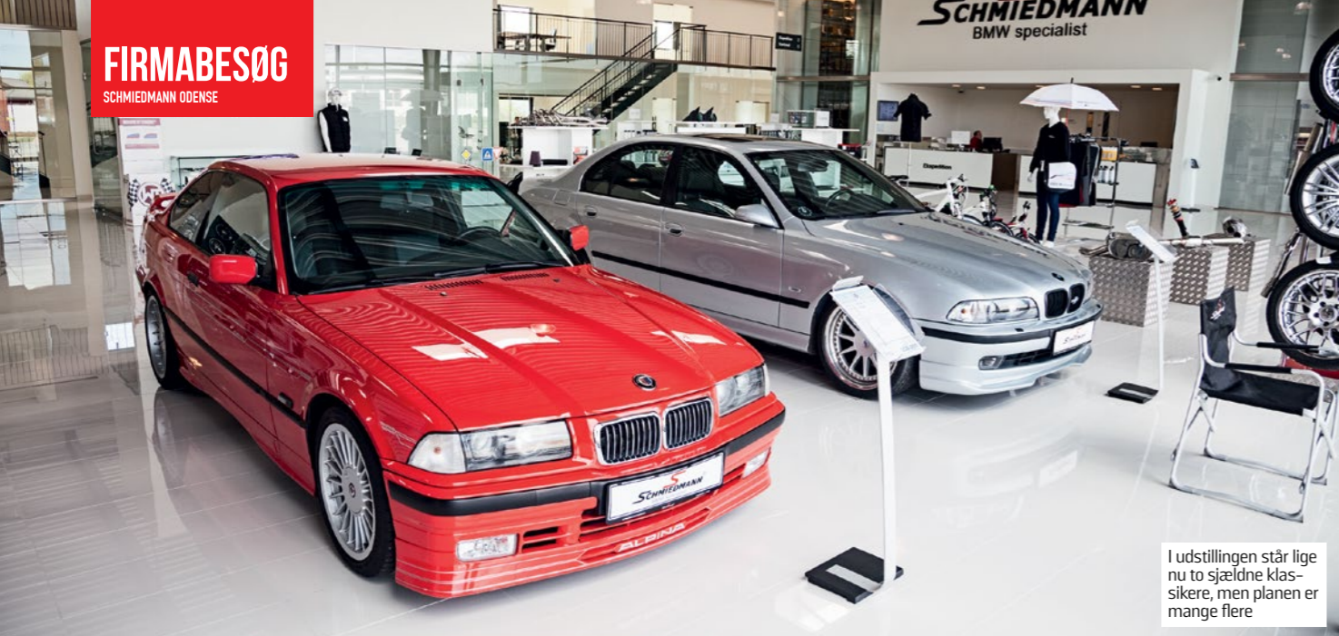
I udstillingen står lige nu to sjældne klassikere, men planen er mange flere