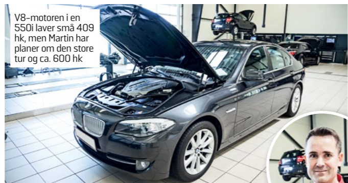
V8-motoren i en 550i laver små 409 hk, men Martin har planer om den store tur og ca. 600 hk