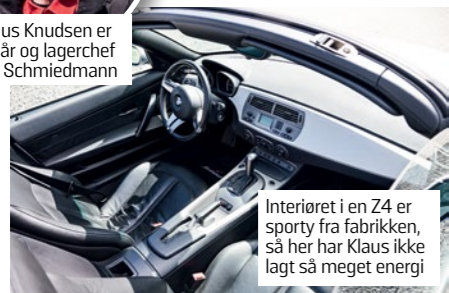
Interiøret i en Z4 er sporty fra fabrikken, så her har Klaus ikke lagt så meget energi