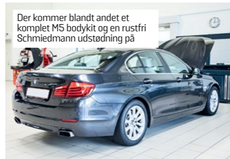
Der kommer blandt andet et komplet M5 bodykit og en rustfri Schmiedmann udstødning på