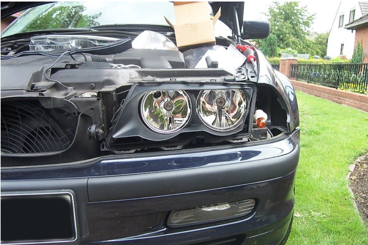
9b. Hier noch mal mit der Scheinwerferblende