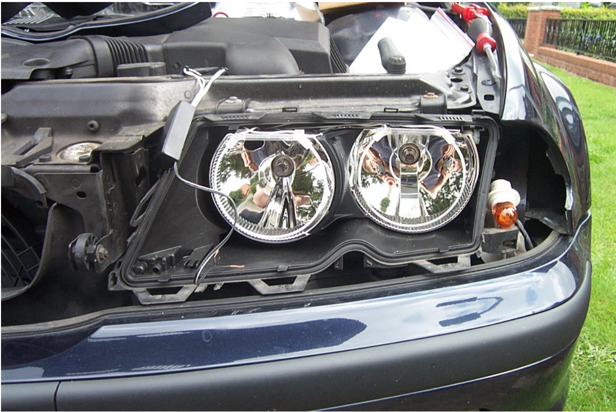
9a. So sollte es dann bei euch ausschauen.